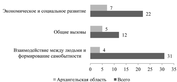
Рис. 3. Распределение одобренных проектов по приоритетам программы «Коларктик»

Наибольшее количество проектов с участием Архангельского региона лежит в приоритетной области «Экономическое и социальное развитие» (рис. 3). Данные проекты преследовали