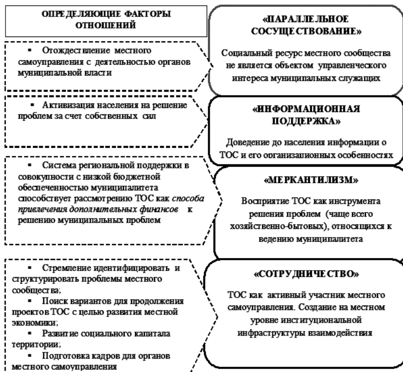
Рис. 2. Трансформация отношения органов местного самоуправления к ТОС

По оценкам экспертов, на практике доминируют позиции, обозначенные как «информационная поддержка» и «меркантилизм». Однако перспективы развития ТОС мы связываем с моделью «сотрудничество», которая предполагает активное вовлечение ТОС в местную политику,